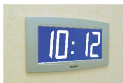
Opalys 14 auf einem Einbauträger

Der NTP Server muss eine Sendezeit (Poll) von unter 128 Sekunden haben.