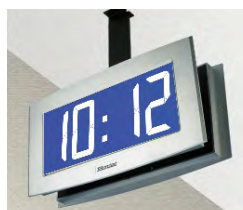
Opalys 14 auf einem doppelseitigen Halter