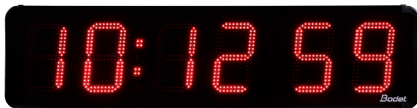
Uhr mit Anzeige von Stunden / Minuten / Sekunden