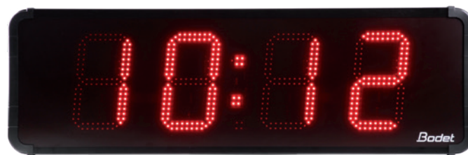
Uhr mit Anzeige von Stunden/Minuten - Datum - Temperatur