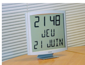
Cristalys date auf einem Tischträger

PoE (Power over Ethernet) Versorgung ist über Netzwerk durch einen RJ45 Stecker. Der NTP Server muss eine Sendezeit (Poll) von unter 128 Sekunden haben.