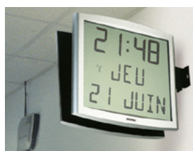
Cristalys date auf einem doppelseitigen Träger