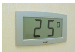
Cristalys 14 auf einem Einbauträger

Sie wählen auch automatisch die richtige Zeitzone. PoE (Power over Ethernet) Versorgung ist über Netzwerk durch einen RJ45 Stecker. Der NTP Server muss eine Sendezeit (Poll) von unter 128 Sekunden haben.