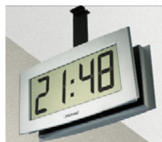
Cristalys 14 auf einem doppelseitigen Halter