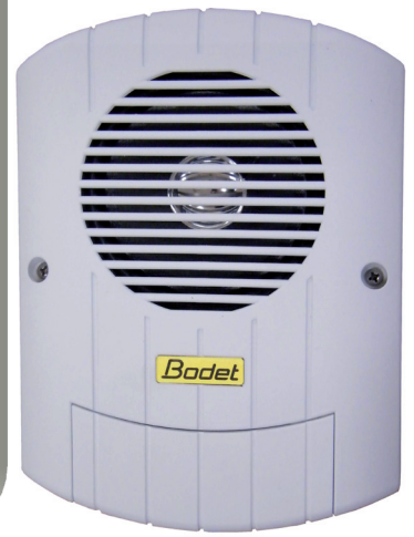
Modell für Innen